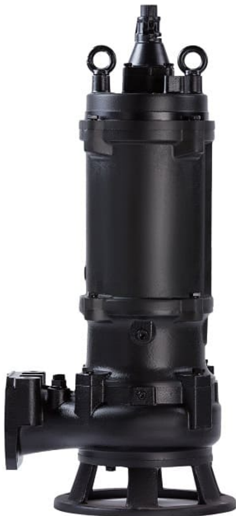
Фото Погружной дренажный насос CNP 80WQ 80-43-22H AC(I)

Отправьте запрос на коммерческое предложение и получите индивидуальные цены и сроки поставки. Насосное оборудование: циркуляционные, многоступенчатые, погружные, дренажные и канализационные насосы. Подбор, поставка, цены, технические консультации и доставка