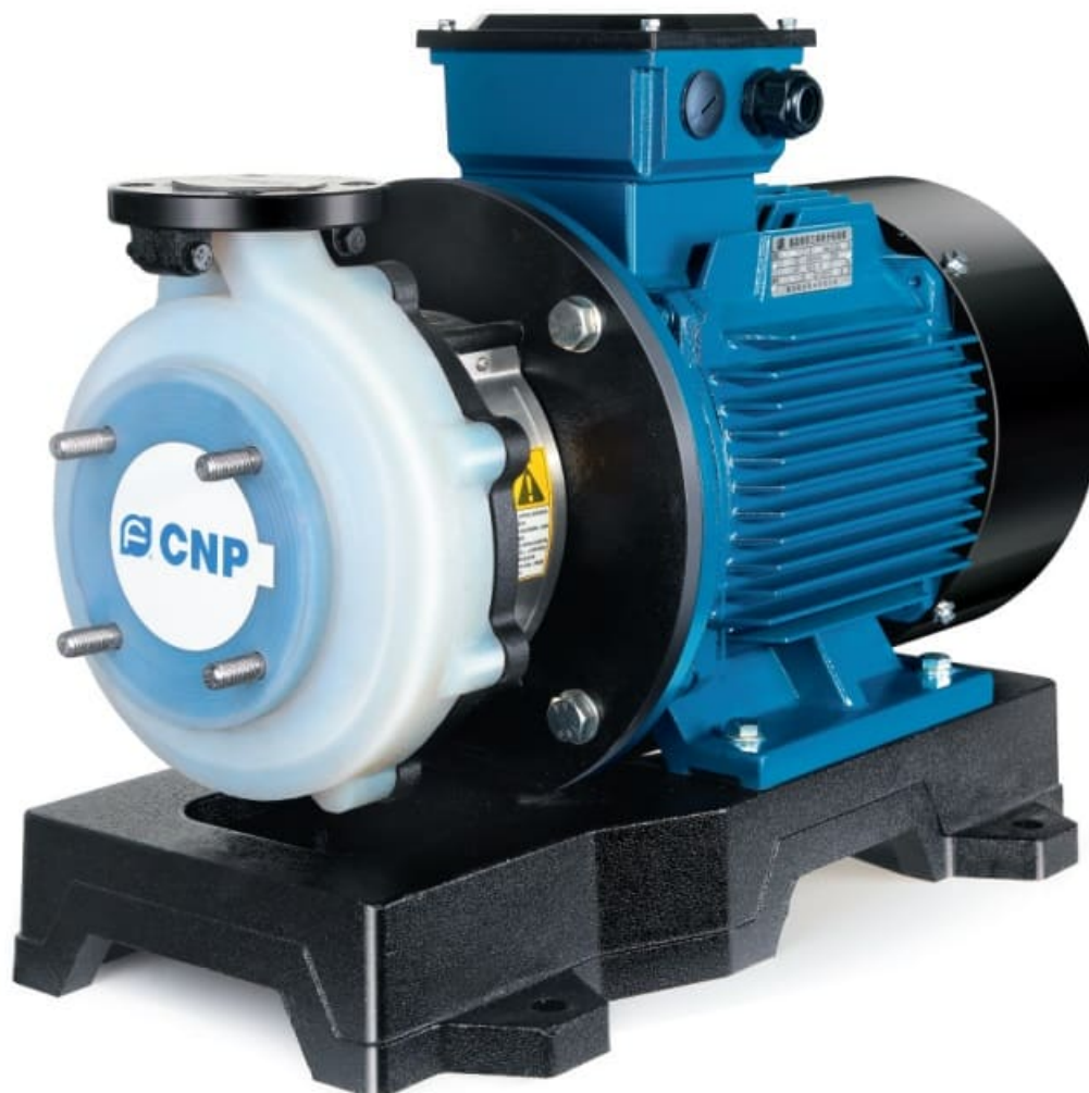
Фото CNP SZ40-25-125F26 химический насос

Отправьте запрос на коммерческое предложение и получите индивидуальные цены и сроки поставки. Насосное оборудование: циркуляционные, многоступенчатые, погружные, дренажные и канализационные насосы. Подбор, поставка, цены, технические консультации и доставка