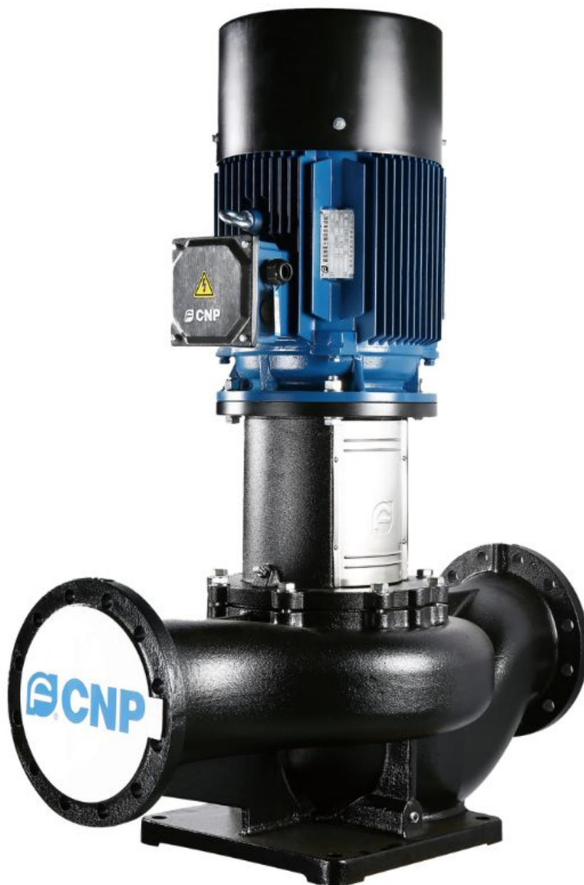
Фото CNP TD50-28G/2SWHCJ насос циркуляционный с сухим ротором, 4 кВт, 3x380 В, DN50, PN 12, 110 °С

Отправьте запрос на коммерческое предложение и получите индивидуальные цены и сроки поставки. Насосное оборудование: циркуляционные, многоступенчатые, погружные, дренажные и канализационные насосы. Подбор, поставка, цены, технические консультации и доставка